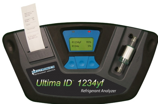
Fot.3. Ultima ID – identyfikator czynników chłodniczych firmy Neutronics Inc