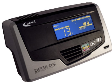
Fot. 1. DEGA 05 – detektor R1234yf – wykrywa obecność w otaczającym powietrzu czynnika R1234yf, R134a, R12, Propan-Butan i inne

Serwis samochodowy posiadający wieloskładnikowy analizator czynników chłodniczych uzyska przewagę nad konkurencją, wprowadzi kolejne specjalizowane usługi, będzie potrafił rozwiązywać trudne przypadki, uniknie różnorodnych problemów i strat.