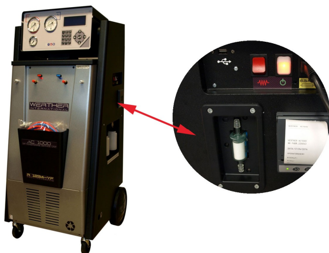
Fot.2. WERTHER AC1000 - stacja obsługowa do czynnika R1234yf wyposażona opcjonalnie w niezależny identyfikator wielokładnikowy