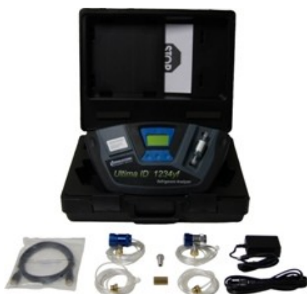
Fot. 4. Identyfikator czynników chłodniczych z wyposażeniem