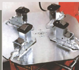
H912 (opcja) Zestaw adapterów motocyklowych 8"-23"

Oslony z tworzywa sztucznego stopy roboczej aby chronić powierzchnię obręczy ze stopów lekkich, pojemnik smaru z uchwytem, regulator ciśnienia powietrza, naolejacz powietrza, pistolet do pompowania z manometrem, łyżka do opon