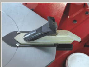
Nakładki ochronne ALU