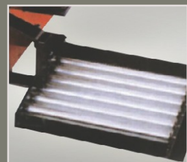
Roller (opcja) Przystawka ułatwiająca obracanie kołem przy odrywaniu obrzeża opony