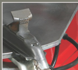
Inflator Titanium 300 wyposażona jest w fabryczny inflator pozwalający na szybkie doszczelnienie obrzeża opon w czasie pompowania