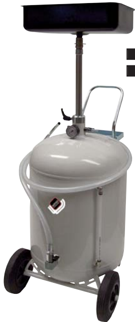
■ 1803 ■ 1804