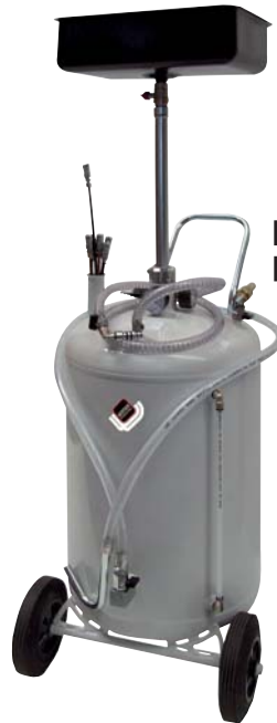
■ 1832 ■ 1833