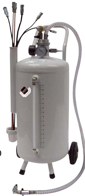
■ 1830 ■ 1831