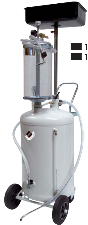
■ 1839 ■ 1840