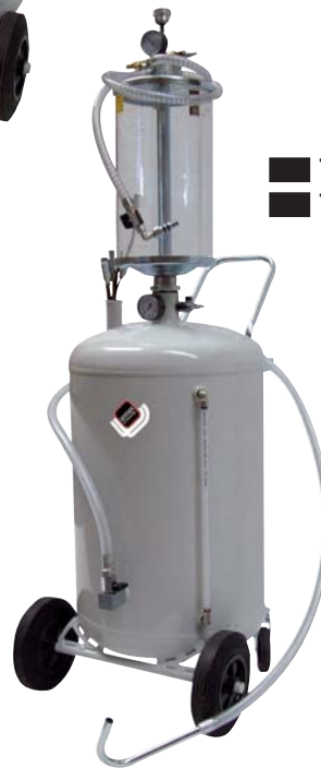
■ 1836 ■ 1837